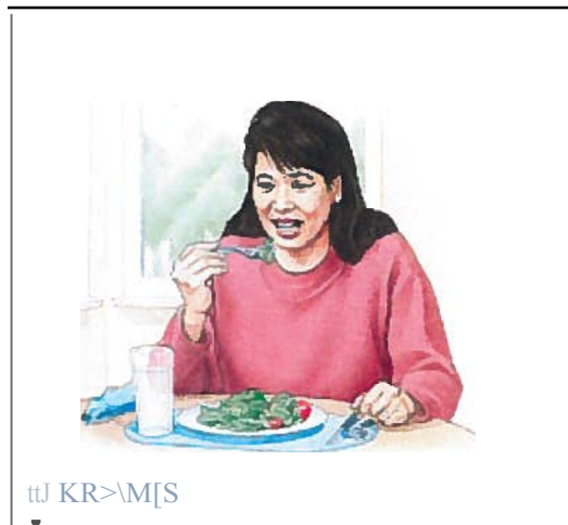
Соблюдайте здоровое питание.